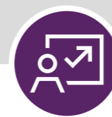
Betriebswirtschaft & Recht

Dein Know-how wird zum Schlüssel, um in der Führungs- und Managementebene zukünftigen Herausforderungen erfolgreich begegnen zu können.